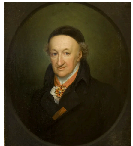
Christoph Martin Wieland, Gemälde von Gerhard von Kügelgen, 1808