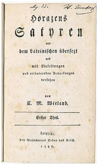
Titelseite von Band 1 der Übersetzung der horazischen Satyren