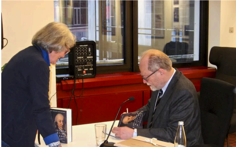
Der Publizist beim Signieren seiner Bücher.

ren Gründer und Leiter des Hamburger Instituts für Sozialforschung für die Veranstaltung gewonnen zu haben.